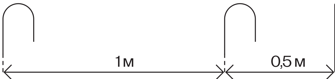
рис. 3 Расстояние между крокетными воротами и колышком